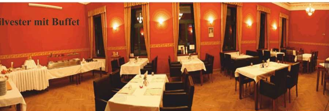
Silvester mit Buffet